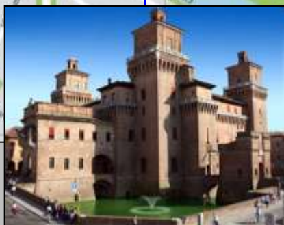
Sede del convegno