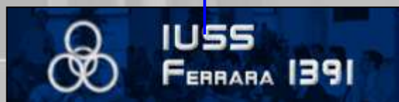
Sede Giornata di Studio e Formazione